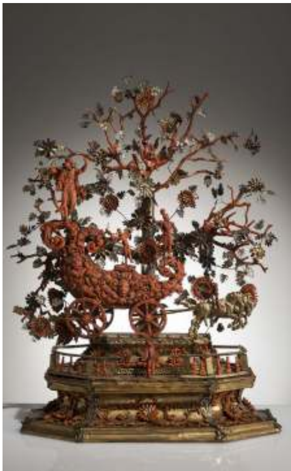
Fig. 8 - Maestranze trapanesi e palermitane, Trionfo con Apollo Sole , fine XVII secolo, Palermo, collezione Whitaker (inv. 632).