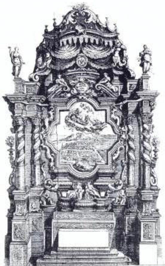
Fig. 19 - Paolo Amato, Disegno per apparato festivo dell'altare maggiore della Cattedrale di Palermo , 1697, Palermo, Galleria Regionale della Sicilia di Palazzo Abatellis, Gabinetto dei Disegni e delle Stampe.