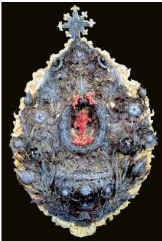
Fig. 17 - Francesco Palumbo, Acquasantiera con S. Rosalia e il Genio del Fiume Oreto , 1678, collezione privata.