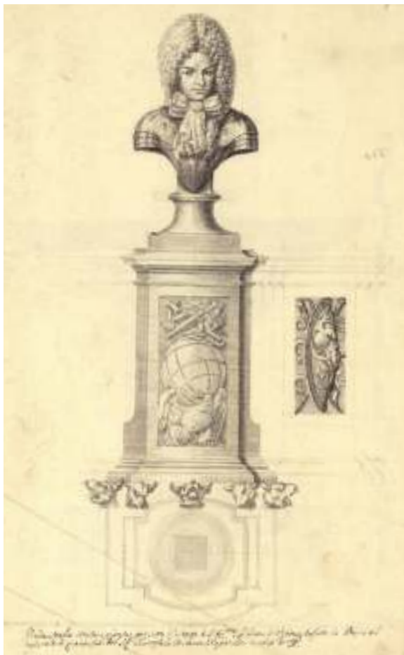
Fig. 3 - Giacomo Amato, Antonio Grano, Busto del duca di Uzeda , fine del XVII secolo, Palermo, Galleria Regionale della Sicilia di Palazzo Abatellis, Gabinetto dei Disegni e delle Stampe.