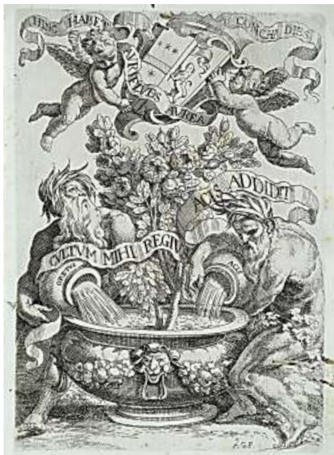
Fig. 5 - Antonio Grano, Antiporta con Scena allegorica , 1694, in I. de Vio, Li giorni d'oro... , 1694.