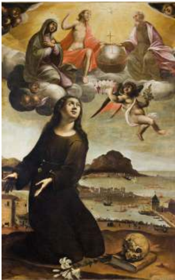
Fig. 1 - Vincenzo La Barbera, Santa Rosalia intercede per Palermo , 1624, Palermo, Museo Diocesano.