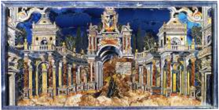
Fig. 9 - Marmorari palermitani, Paliotto prospettico in tarsia marmorea , 1683, Santo Stefano Quisquina, Cappella dell'eremo, altare maggiore.