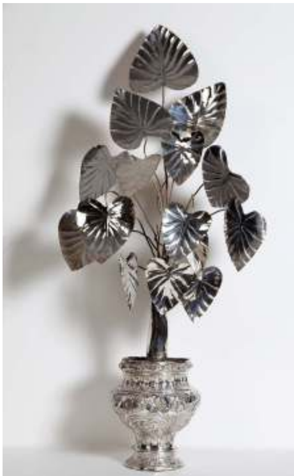
Fig. 4 - Argentieri palermitani (vasi) e Vincenzo Papadopoli (foglie), Serie di vasi con "pampini di Paradiso" , 1683 (vasi) e 1765 (foglie), Palermo, Cappella Palatina.