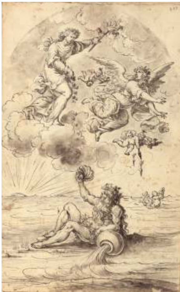
Fig. 20 - Antonio Grano, Allegoria con l'Aurora (S. Rosalia) e il fiume Oreto (Palermo) , fine del XVII secolo, Palermo, Galleria Regionale della Sicilia di Palazzo Abatellis, Gabinetto dei Disegni e delle Stampe.