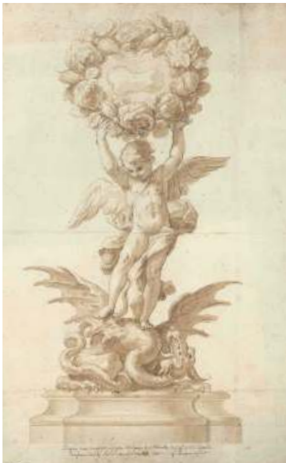
Fig. 14 - Giacomo Amato, Antonio Grano, Studio per reliquiario di Santa Rosalia , ante 1692, Palermo, Galleria Regionale della Sicilia di Palazzo Abatellis, Gabinetto dei Disegni e delle Stampe.