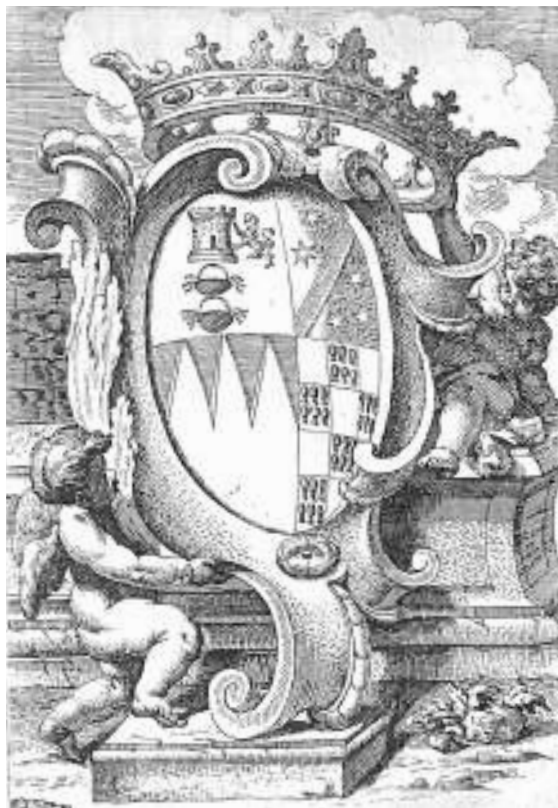
Fig. 16 - Scudo del duca di Uceda , 1689, in Francisco Antonio Montalvo, Noticias funebres de las magestosas exequias que hizo la felicissima ciudad de Palermo[...] en la muerte de Maria Luysa de Borbon , Palermo 1689.