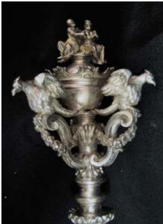
Fig. 18 - Argenteo palermitano, Mazza processionale con Santa Rosalia e il Genio di Palermo , fine del XVII – inizi del XVIII secolo, Palermo, Santuario di Santa Rosalia di Monte Pellegrino.