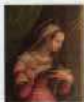
PARROCCHIA SANTA MARIA MAGGIORE GERACI SICULO