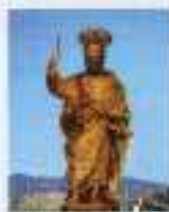
ASSOCIATIVE SAN BARTOLOMEO APOSTOLO GERACI SICULO